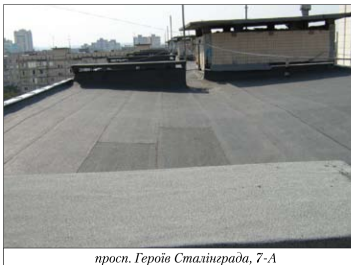
просп. Героїв Сталінграда, 7-А