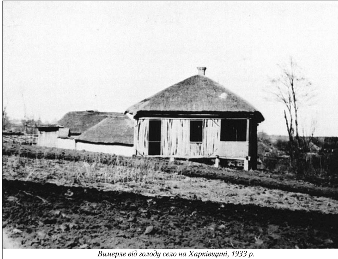
Вимерле від голоду село на Харківщині, 1933 р.

Начальник Оболонського районного управління юстиції у м. Києві Олег Цалько